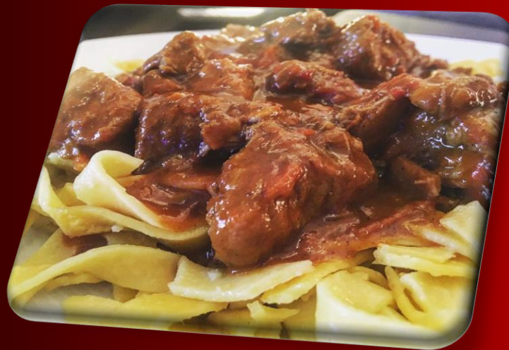
Rindergulasch mit Nudeln