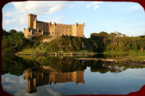
Dunvegan Castle Seat of the chiefs of the Clan MacLeod

Selbst das kleinste Clanmitglied hat den gleichen Stellenwert wie der engste Verwandte des Clanchefs was man nur bewundern kann.