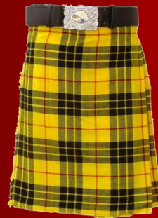
Tartan of the Clan MacLeod